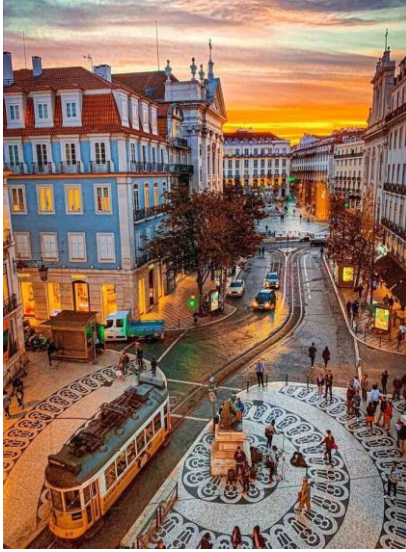
Lisboa - Portugal