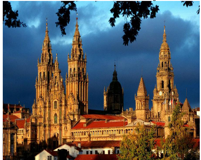
Catedral Basílica de Santiago de Compostela - Espanha

Período: 16 a 29 de Junho de 2024 - 14 Dias - Roteiro nº 240616BV04