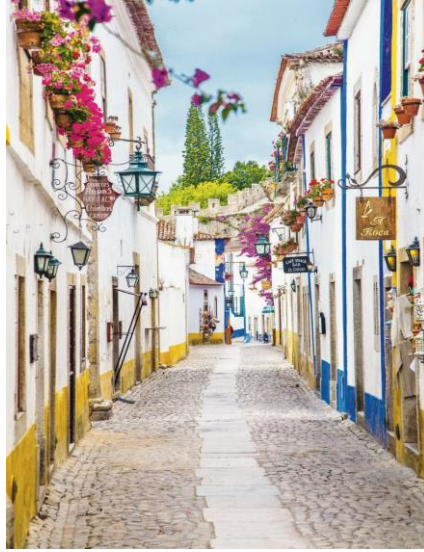
Óbidos - Portugal