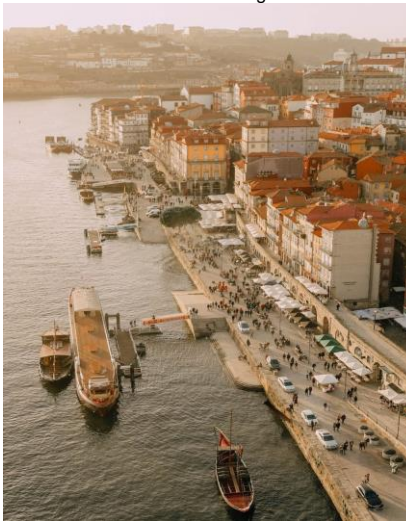
Porto - Portugal