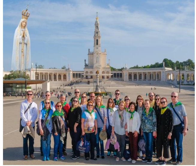
Santuário Nossa Senhora de Fátima - Portugal